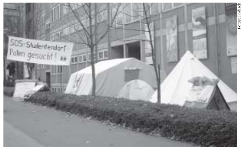
Zelten gegen Studiengebühren: Mit diesen und anderen Aktionen wurden die Proteste der Studierenden gegen die Pläne der Landesregierung bis Redaktionsschluss fortgesetzt