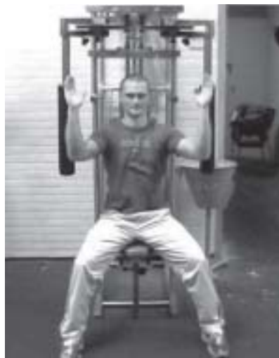
Im gut ausgestatteten Krafraum des ZfH können gezielt die Rückenmuskeln trainiert werden: Links die »Back-Extension« zur Kräftigung der langen Rückenstrecker, auf dem rechten Bild der sogenannte »Butterfly-Invers« zum Training der Rückenmuskulatur im Schulterblattbereich.