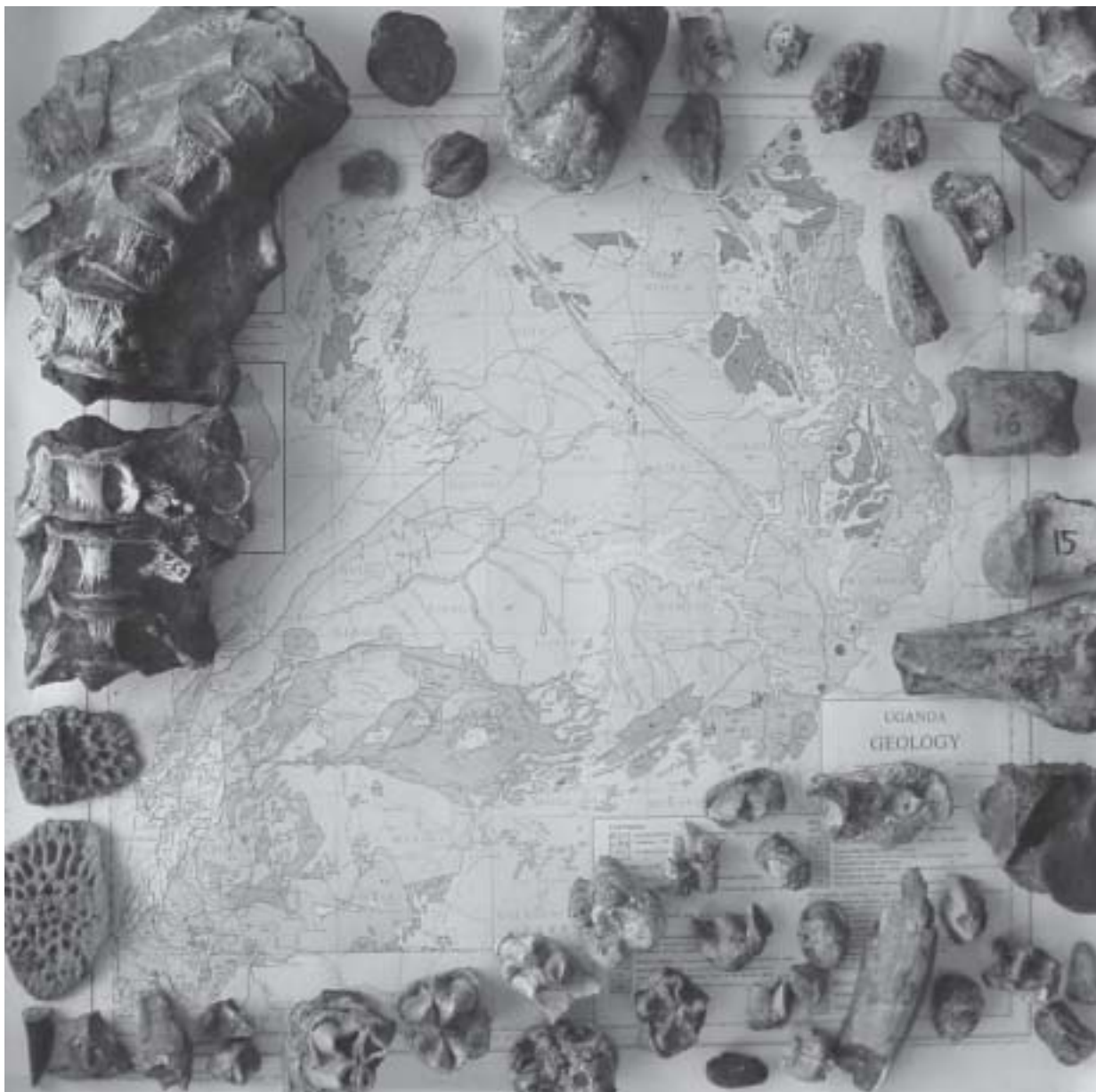
Jenseits der Ruwenzoris: Überreste unterschiedlicher Wirbeltieren aus den Riftsedimenten des Albert Beckens. Die Tiere lebten vor vier bis sechs Millionen Jahren (oben). Bigo-Valley an der Ostflanke der Ruwenzorigebirge. Das etwa 3500 m hoch gelegene, erdgeschichtlich junge Tal ist vollständig von einem Hochmoor bedeckt. Steile, tief eingeschnittene Talflanken und starke Erosion belegen das Bildungsalter von etwa ein bis zwei Millionen Jahren (unten). Blick von den nördlichen Ausläufern der Ruwenzori Berge nach Westen auf das Semliki- und die westliche Flanke des Albert Beckens. Noch vor wenigen Millionen Jahren erstreckte sich der Albert-See wesentlich weiter nach Süden und das Tal war Teil eines großen Riftsees, des Paläo Lake Albert.