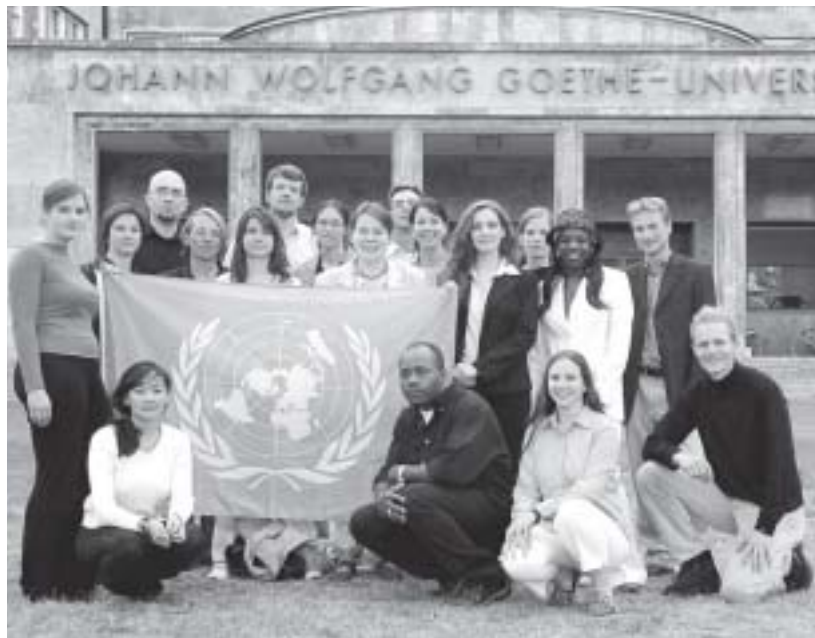
Insel-Positionen: Die Frankfurter Delegation des Projekts »National Model United Nations« (KMUN) repräsentiert Tuvalu, Kap Verde und Domenica im kommenden April in New York.

»Dominica moves for a suspension of the meeting for the purpose of caucusing«, beantragt Andrea nach den ersten Ansprachen eine Sitzungsunterbrechung für informelle Verhandlungen. Jetzt gilt es, in kleinen Gesprächsgruppen mit möglichen Koalitionspartnern zu verhandeln und Mehrheiten für die eigene Position zu finden. Jeder Delegierte versucht, andere von der Dringlichkeit seines Anliegens zu überzeugen