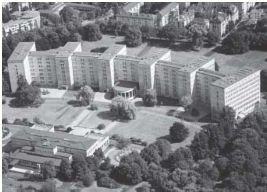
Drum singe, wem Gesang gegeben: Auf dem Campus Westend wird am 30. Mai eine festliche musikalische »italienische Nacht« in Zusammenarbeit mit der Oper Frankfurt stattfinden

Physik und Physikalischer Verein feiern 2x90 Jahre ihres Bestehens im Rahmen international hochrangig besetzter Vorträge und Symposien, die sich mit der exzellenten Forschungstradition und den grundlegenden Arbeiten befassen, die der Physik in Frankfurt Weltgeltung und Nobelpreise eingetragen haben. Die gerade in den letzten Jahren sehr aktiven und überaus erfolgreichen Archäologen werden einen kultur- und naturwissenschaftlichen Einblick in die Forschungsfragen, die Ergebnisse und damit in das wissenschaftlich vermutete Alltagsleben in jenen Regionen des Nahe Ostens