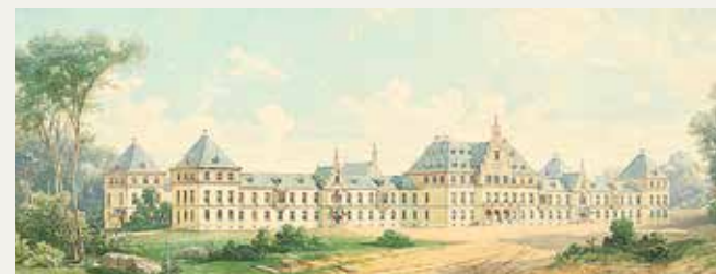
Vorderansicht der Anstalt. Handzeichnung des Architekten Oskar Pichler (ca. 1863).

Um ihre Deutung zu stützen, zogen die Uni-Archäologen den Landschaftsarchitekten und Eiskeller-Experten Albrecht Schlierer zu Rate, der die Besonderheiten des