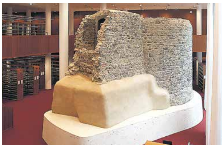
Das Denkmal in der neuen Bibliothek. An der linken offenen Seite des Bauwerkes erkennt man die Reste der Flügelwände. Die Grafik oben rechts verdeutlicht die Form, die das Gebäude einmal hatte (Zeichnung: Albrecht Schlierer).

www.eiskeller-frankfurt.blogspot.com und A. Hampel, Der Affenstein. Ein mittelalterlicher Wachturm und seine wechselhafte Historie durch sechs Jahrhunderte. Fundberichte aus Hessen 50, 2010, Wiesbaden 2012, S. 729-760.